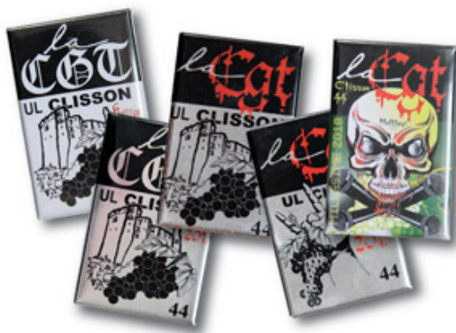
Badges CGT Hellfest

– Réalisations graphiques de badges dont celui pour la C.G.T. aux millésimes du Hellfest à Clisson (44).