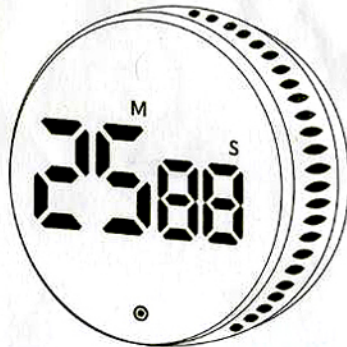
Minuteur magnétique / Magnetic timer / Magnotische timer / Temporizador magnético / Temporizador magnético / Magnotischer digitaler timer