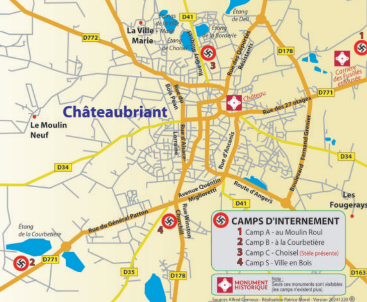
Si les camps n'existent plus aujourd'hui, une stèle, en mémoire du camp de Choisel a été érigée rue Guy Môquet à Châteaubriant.