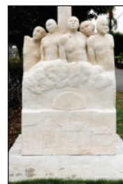
Stèle du camp de Choisel, rue Guy Môquet à Châteaubriant.