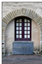
Plaque mémorielle au château à Châteaubriant.

Situé dans l'ancienne ferme, le musée est géré depuis 2006 par l'Association des Amis du Musée de la Résistance de Châteaubriant (AMRC), affiliée au Musée de la Résistance nationale (Champigny-sur-Marne). Cette association assure les visites guidées du musée et de la carrière.